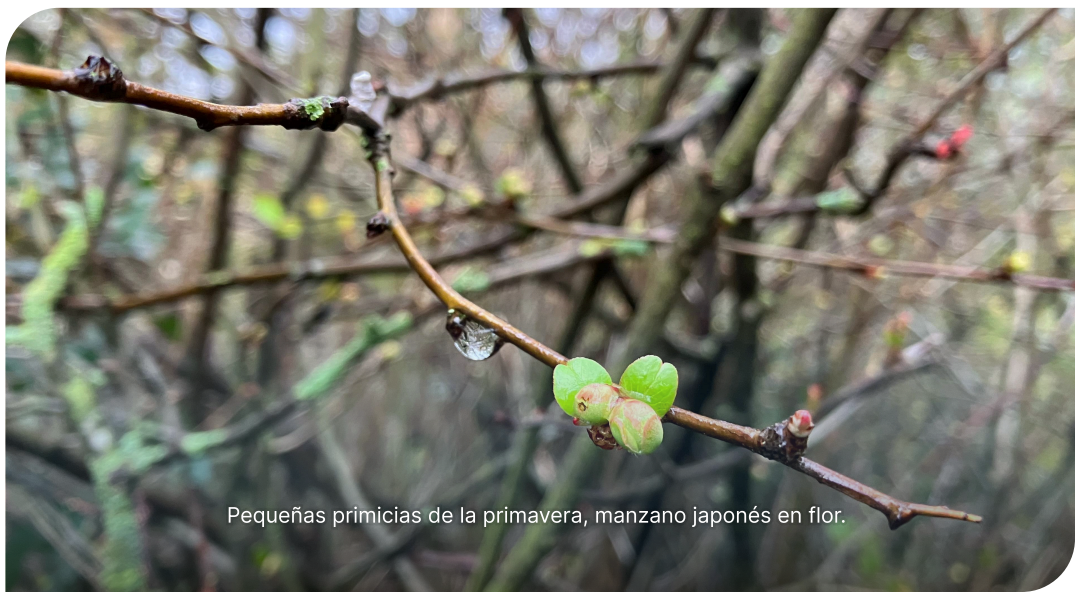
Pequeñas primicias de la primavera, manzano japonés en flor.