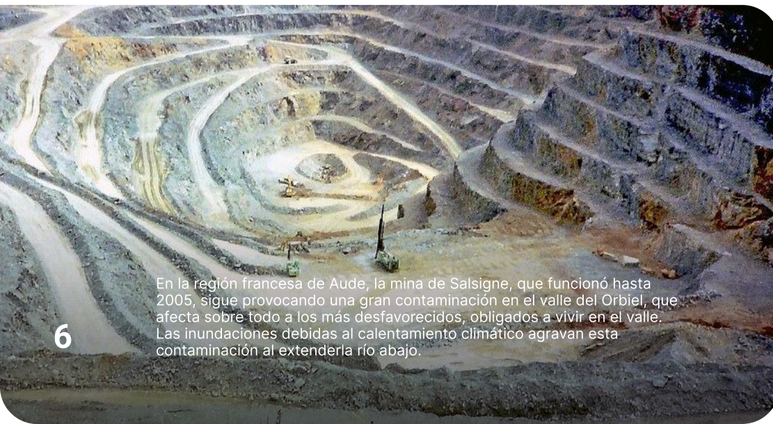
En la región francesa de Aude, la mina de Salsigne, que funcionó hasta 2005, sigue provocando una gran contaminación en el valle del Orbíel, que afecta sobre todo a los más desfavorecidos, obligados a vivir en el valle. Las inundaciones debidas al calentamiento climático agravan esta contaminación al extenderla río abajo.